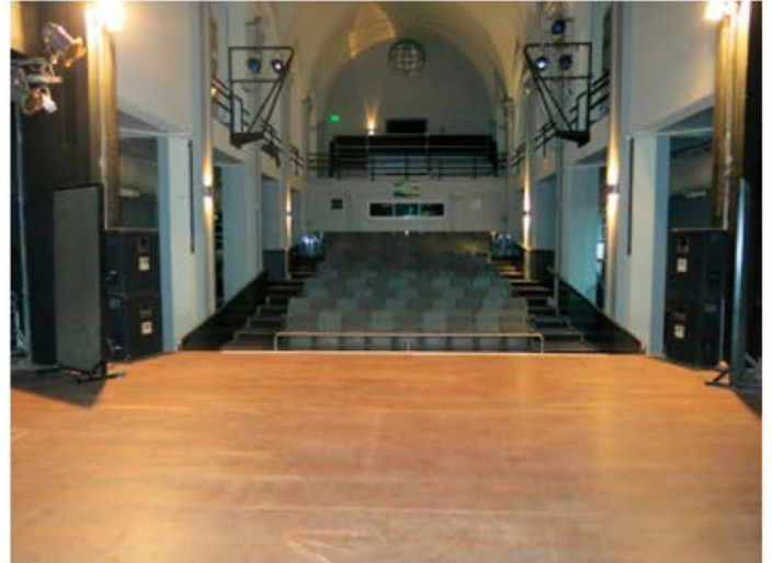
VISTA DESDE EL ESCENARIO