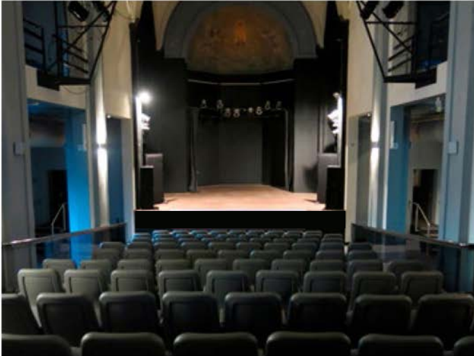
VISTA HACIA EL ESCENARIO